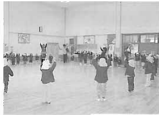
保育園運営事業 交付額 15,500千円 福祉サービスの充実に役立っています。