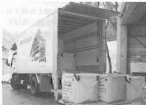
ごみ収集運搬事業 交付額 7,500千円 環境の維持・保全・向上に役立っています。