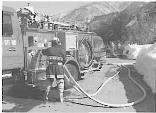
常備消防運営委託事業 交付額 27,000千円 消防行政業務の充実に役立っています。

電源立地地域対策交付金の助成により、次の事業を実施しました。この交付金は、発電用施設の立地地域・周辺地域で行われる公共施設整備や住民福祉の向上に役立つ事業に対して交付され、発電用施設の設置に係る地元の理解促進等を図ることを目的とされています。