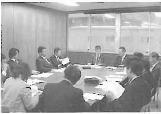
統合整備委員会・教育課程部会の模様

A8: 白川村教育会の組織に、本年度から新しく教育課程作業部会を設けました。この部会では、小学校の新しい学習指導要領の完全実施と統合小学校の開校が共に平成23年度であるため、統合を重視した新しい教育課程(指導計画)の作成に取り組んでいます。