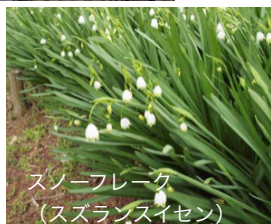
スノーフレーク (スズランスイセン)