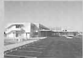
可茂特別支援学校(美濃加茂市)

県教育委員会では、「子どもかがやきプラン」に基づき、障がいのある子どもたちが地域で育ち、学べるよう、特別支援学校を地域ごとに整備しており、4月には可茂地域に特別支援学校を開校します。