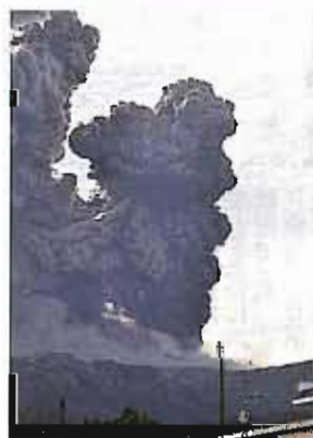
▲勢いよくあがる噴煙

白川村では、連合の仲間である両町の被災された方々や、地域復興支援のため、義援金の募集を行います。募金箱を、役場と白川・平瀬診療所に設置しましたので、皆さんの温かいご協力をお願いします。