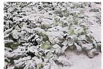
火山灰に覆われた ホウレン草▶