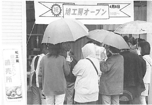
開店直後の直売所

4月8日(金)、10時のオープンと同時に多くの村民の方が訪れ、用意した400個の米粉パンがあつという間に完売し、上々の滑り出しとなりました。