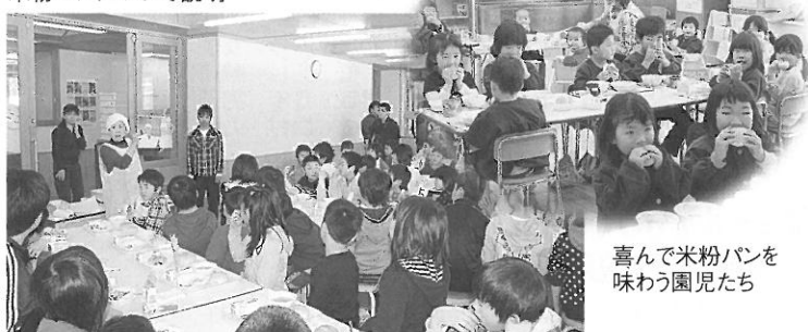
喜んで米粉パンを味わう園児たち