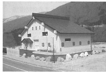
平瀬クリーンセンター