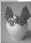
[青羽蝶小花瓶] 1904-22 個人蔵

9月16日(金)～11月27日(日) 一般800円、大学生600円、高校生以下無料