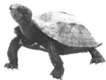
国の天然記念物でもあるリュウキュウヤマガメ

9月17日(土)～19日(月・祝)の3日間、65歳以上の方の入館料が無料となります。