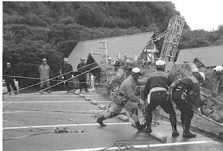
(救助訓練をする消防署員)

この訓練は、例年この時期に実施しているもので、森林公社、消防団、役場、警察署、消防署が参加し、事故が発生した時に迅速に対応できるよう連携の強化を図りました。 スーパードから車が転落したとの想定で救助訓練を実施し、それぞれの役割を確認しました。