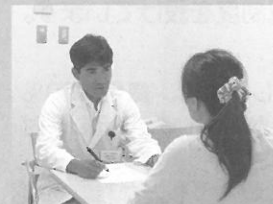
相談風景 (イメージ)