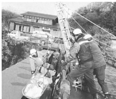
救助訓練を行う消防署員