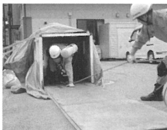
狭所での訓練を行う職員