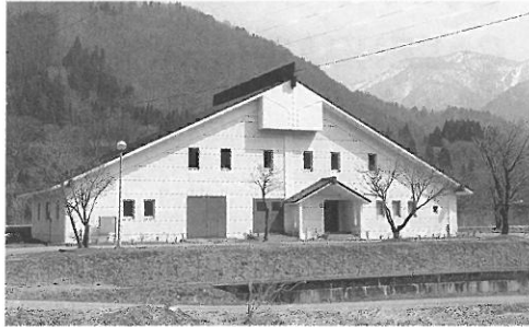
白川クリーンセンター