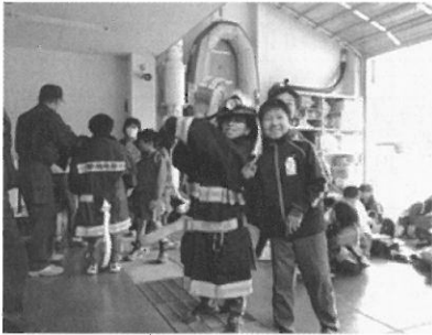
機械器具に触れる児童たち

児童のみなさんからは「村の消火施設は何がありますか?」「災害現場でどんな不安がありますか?」など、たくさん質問が飛び交い、消防署の仕事と同時に、火災予防についても理解を深めていただきました。