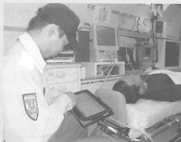
配備されたタブレット端末を使う救急隊員

員がタブレット端末を使って直接入力することで、情報が随時更新され、他の救急隊員がそれらの最新情報を現場で即、利用できるようになりました。救急隊員は医療機関ごとの最新の搬送情報を即時に把握し、患者の搬送先を検討・確認できます。