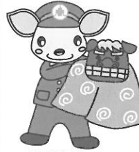
こあんちゃん 高山地区交通安全協会 白川支部