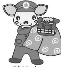
こあんちゃん 高山地区交通安全協会 白川支部