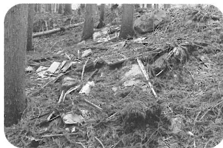
国道360号沿い山林の不法投棄

近年、村内の河川や山林等への「家庭ごみの不法投棄」がしばしば見受けられ、村内一斉美化運動でも大量の不法投棄（ブラウン管テレビや古タイヤ等）を確認しました。ごみの処分に困っていることがありましたら、役場又はリサイクルハウスへ相談いただき、むやみにごみを捨てないようにしましょう。