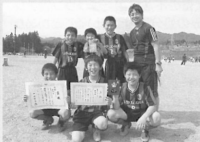
Bクラス5年生の部 優勝