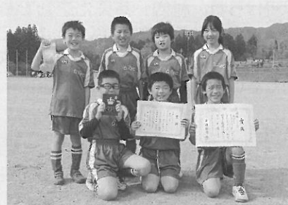
Cクラス4年生の部 優勝