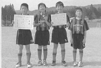
Aクラス6年生以下の部 準優勝

第20回郡上市ミニサッカー大会 4月29日(月) 郡上市合併記念公園グラウンド 白川少年サッカークラブ