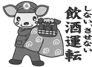
こあんちゃん 高山地区交通安全協会 白川支部