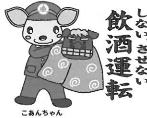
こあんちゃん 高山地区交通安全協会 白川支部