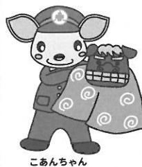
こあんちゃん 高山地区交通安全協会 白川支部