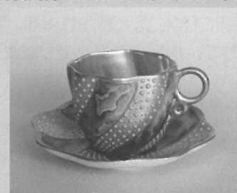
コールポート 《金彩ジュールめう模様カップ&ソーサー》

多治見市東町4-2-5 ☎0572(28)3100 休 / 月曜日(祝日の場合は翌平日) 開館時間 / 10:00~18:00(入館は17:30まで)