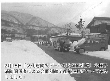
2月18日「文化財防火デーに伴う消防訓練」の様子 消防関係者による合同訓練で組織連携について確認しました！

住宅用火災警報器に使用されている電池の寿命は一年から十年と製造の時期やメーカーにより異なりますが、製品仕様に定めた電池の寿命を満たさず、短い時期で電池が切れる場合がありますのでご注意ください。