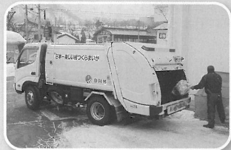
ごみ収集運搬事業