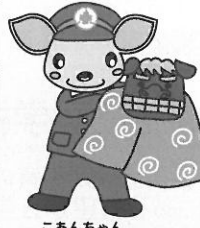
こあんちゃん 高山地区交通安全協会 白川支部