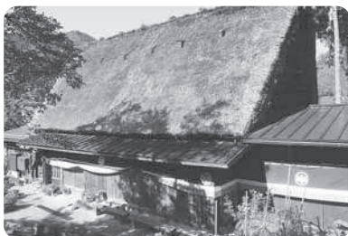
大田利展家主屋(修理前)