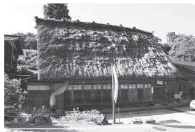
和田利治家主屋(修理前)