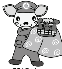
こあんちゃん 高山地区交通安全協会 白川支部