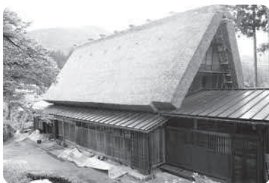
大田利展家主屋(修理後)