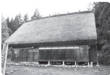
日本ナショナルトラスト旧寺口家主屋(修理後)