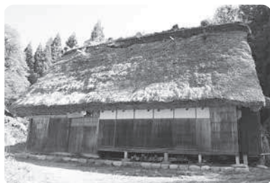
日本ナショナルトラスト旧寺口家主屋(修理前)