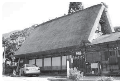
和田利治家主屋(修理後)