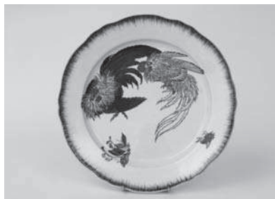
《「ルソー」シリーズ 雄鶏に熊蜂図皿》 クレイユ・エ・モントロー陶器工場 フェリックス・ブラックモン 1867年 Y. & L. ダルピス蔵

19世紀後半フランスにて巻き起こったジャポニスムや印象主義の影響は、陶磁器の分野にも及びました。本展では、浮世絵をモチーフに取り入れたテーブルウェアや、印象派絵画に着想を得た陶磁器作品を紹介します。