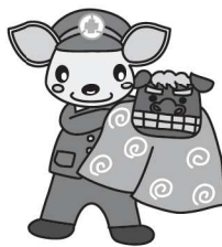
こあんちゃん 高山地区交通安全協会 白川支部