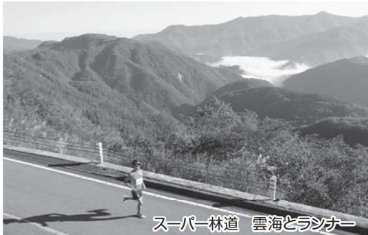
スーパー林道 雲海とランナー

9月21日に、白川村と石川県白山市を結ぶ白山スーパー林道で、今年で2回目の開催となる『白山白川郷ウルトラマラソン』が開催されました。心配された天候にも恵まれ、晴天の中、総勢1,137名のランナーが過酷