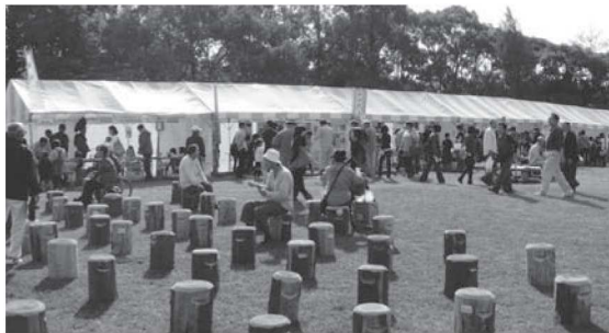
森と木とのふれあいフェア2012の様子

平成27年秋に第39回全国育樹祭を揖斐川町谷汲地内で開催します。この育樹祭を県民総参加で素晴らしい大会にするため、1年前イベントを開催。記念式典のほか、全国育樹祭グッズのプレゼントや揖斐川町の特産品を販売します。