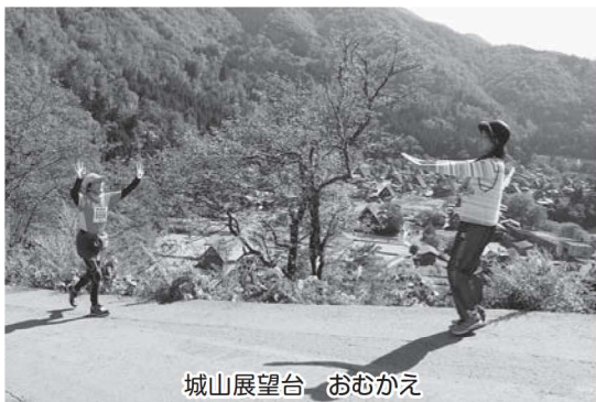
城山展望台 おむかえ