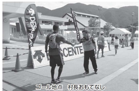
ゴール地点 村長おもてなし