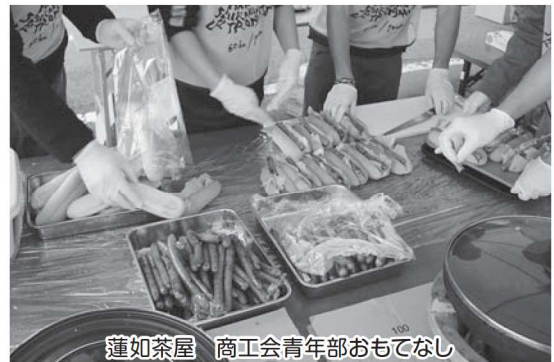
蓮如茶屋 商工会青年部おもてなし

こうして、無事に大会を開催できましたのは大会関係者及びボランティアや村民をはじめ、村民の皆様のご協力あってのことです。ランナーにとって皆さんの応援は、何よりもパワーになったと思います。本当にありがとうございました!