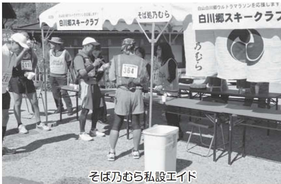
そば乃むら私設エイド

村民をはじめとする約200名のボランティアの皆さんによって、給水エイド、おもてなしブース、コース誘導、ゴール対応など、それぞれの場所で大会を盛り上げていただきました。また、ご協力いただいた各エイドなどに設置した白川村や飛騨地方の特産品などの「おもてなし」は、ランナーからは、昨年以上に大好評! 「こんなにエイドがおいしいウルトラマラソンは他にない!」「走らなきゃいけないのに食べ過ぎる!」と称賛の嵐でした。