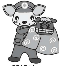
こあんちゃん 高山地区交通安全協会 白川支部