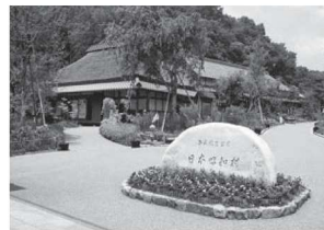
日本昭和村入場門

昭和90年(昭和63年+平成27年)となる年に、昭和30、40年代の活気や楽しさを表現したイベントを行います。春ならではのイベントをはじめ、春の陽気にぴったりなグルメや季節限定の体験など、見て、食べて、体験して、昭和村の春を満喫してください。昭和村で遊んだあとは、昭和銭湯里山の湯の春限定替り湯で春を感じながら疲れを癒していただけます。