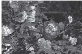
ジュビレデュプリンスドゥモナコ (ロイヤルローズガーデン)

秋は、バラが一年で最も美しく香る季節です。鮮やかな色と豊かな香りに包まれた秋のバラ園をお楽しみください。11月3日(火・祝)は音と光のファンタジー花火コンサートを含む「ナイトローズ」イベントを開催します。