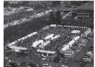
岐阜県農業フェスティバル (昨年の様子)

県内各地から新鮮な野菜や果物、各種畜産物及び水産物、またこれらを用いた加工品が大集合し、その展示即売等が行われます。ぜひご来場いただき、優れた県産農産物を見て、触れて、味わって、岐阜県農業を体感してください。