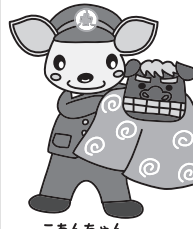
こあんちゃん 高山地区交通安全協会 白川支部