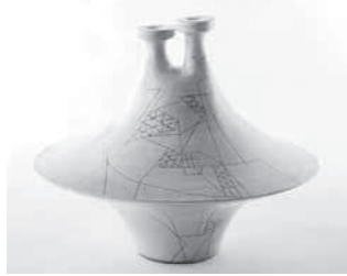
山田光「二つの口の壺」1952年 岐阜県現代陶芸美術館蔵

戦後まもなく、八木一夫や鈴木治らと共に前衛陶芸家集団「走泥社（そうでいしゃ）」を設立した山田光（やまだ・ひかる 1923-2001）。作品受贈を記念し、山田の初期から晩年に至るまでを走泥社関連の作品とあわせ一堂に展示、その時代とともに紹介します。