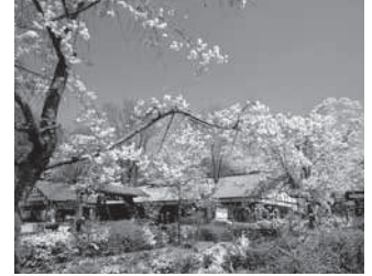
昭和村の正面広場の桜

春の昭和村は桜が綺麗!ナゴヤドーム16個分の敷地に約1,200本の桜が咲き誇ります。桜の開花時期に合わせて、3月下旬～4月上旬にかけて「桜まつり」を開催します。桜にちなんだイベント、グルメ、体験教室が登場し、昭和村が桜一色に染まります。