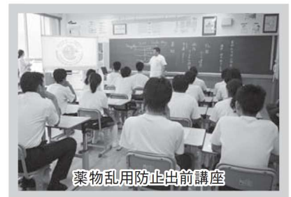
薬物乱用防止出前講座

3年前の小学6年生の頃に同氏による授業を受けた生徒達は、以前のおさらいに加え、この3年間に法改正等で取り締まりが大幅に強化された危険ドラッグの恐ろしさについてビデオを見て学習しました。加えて、たばこは薬物乱用へのゲートウェイとなり得ることを学びました。