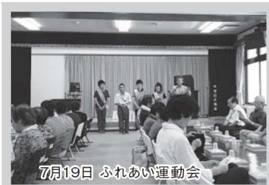
7月19日 ふれあい運動会