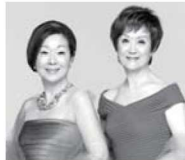
由紀さおりさん(左) 安田祥子さん(右)

開館から1周年の節目にあたり、歌手の由紀さおりさん&安田祥子さんをお迎えした記念コンサートを開催します。「みかんの花咲く丘」、「大きな古時計」、「トルコ行進曲」など、数々の童謡を歌い継いできたお二人が、ぎふ清流文化プラザの開館1周年に華を添えます。