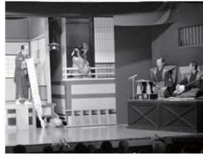
鳳凰座歌舞伎公演「一か茶屋」

開館1周年を記念し、県が誇る「地歌舞伎」の特別公演を開催します。当日は、鳳凰座歌舞伎保存会（下呂市）による公演の他、地元下呂市の特産品の販売も行います。また、公演終了後、ぎふ清流文化プラザの新モニュメントを披露します。