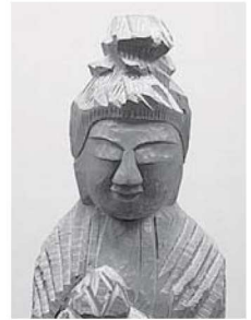
観音菩薩立像（聖観音） （生樹自治会蔵）

江戸時代の僧侶、円空は、美濃国に生まれ、日本各地で現存数5000体を超える仏像を造りました。この特別展は円空仏が集中して現存する東海地方に焦点を当て、貴重な円空仏や円空が描いた希少な絵画合わせて約80点の見応えのある展示となります。展示を通して、それぞれの地域で円空がどのような足跡をのこしていったのかを探ります。東海3県の円空仏が一堂に会するまたとない機会です。