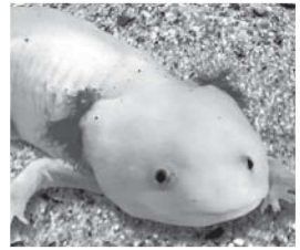
ウーパールーパー

エリマキトカゲやウーパールーパーなど、メディアなどで話題になった懐かしい生きものを集めて、過去から現在まで年代ごとに展示します。小さなお子さんはもちろん、大人の方も楽しめます。