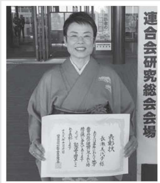
連合会研究総会会場