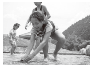
過去の清流長良川あゆパークでのイベントの様子