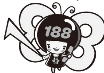
消費者庁 消費者ホットライン188 イメージキャラクター「いやヤン」

大切なのは、すぐに相談することです 困ったときは、一人で抱え込まないで「消費者ホットライン「いやや」（局番なしの188）」までお電話を 『泣き寝入りは超いやや（188）!』で覚えてね