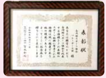
白川村スポーツ協会 バレー部