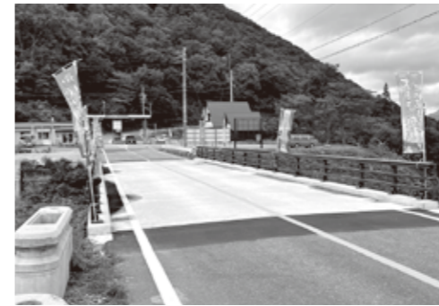
▲村道鳩谷馬狩線 馬狩2号橋復旧工事