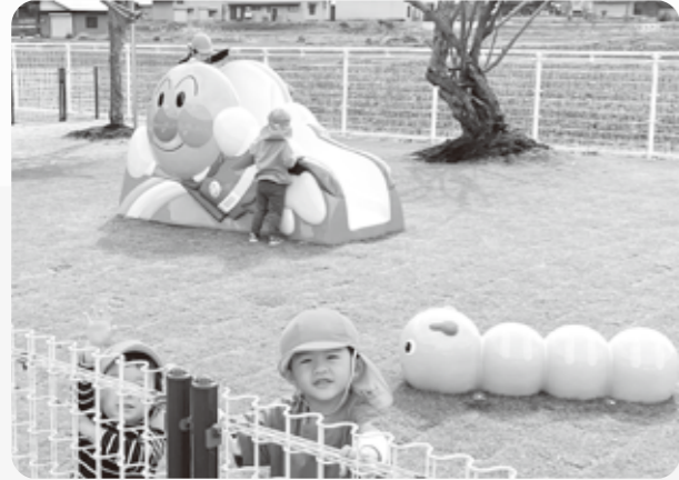
見てえ!アンパンマンのすべりだいでよ!

響があると思っています。お姉さんお兄さんたちは、小さい子たちとふれあうことによって、やがてその経験が母や父になるときの大切な準備になるそうです。昔は兄弟が多く、上の子が下の子の面倒をみたり、近所のお姉さんお兄さんが小さな子のお世話をしたりしていたものが、核家族化、少子化により、失われてきてしまいました。村の保育園にこのつながりが戻って来ることは、良いことだと思っています。