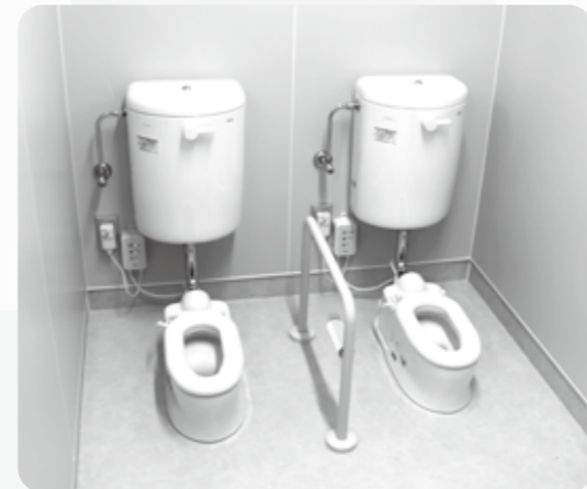
おトイレもふえてピカピカになったよ

昨年度より、希望者の増加と保育士の不足のため、園区に関係なく平瀬保育園で行っていた未満児保育が、この