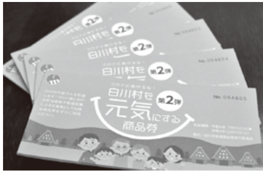
▲白川村を元気にする商品券