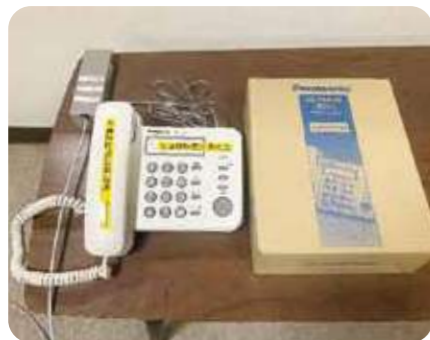
特設公衆電話：避難所開設時の連絡手段

10月20日(木)、荻町公民館において荻町区及び白川村消防団中部分団が合同で「荻町防火デー」を開催しました。