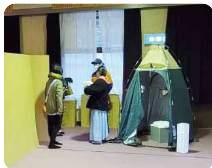
簡易トイレの設置状況