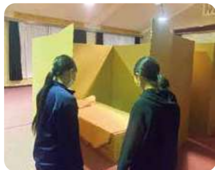
段ボールベッドと段ボールパーテーションの設置状況