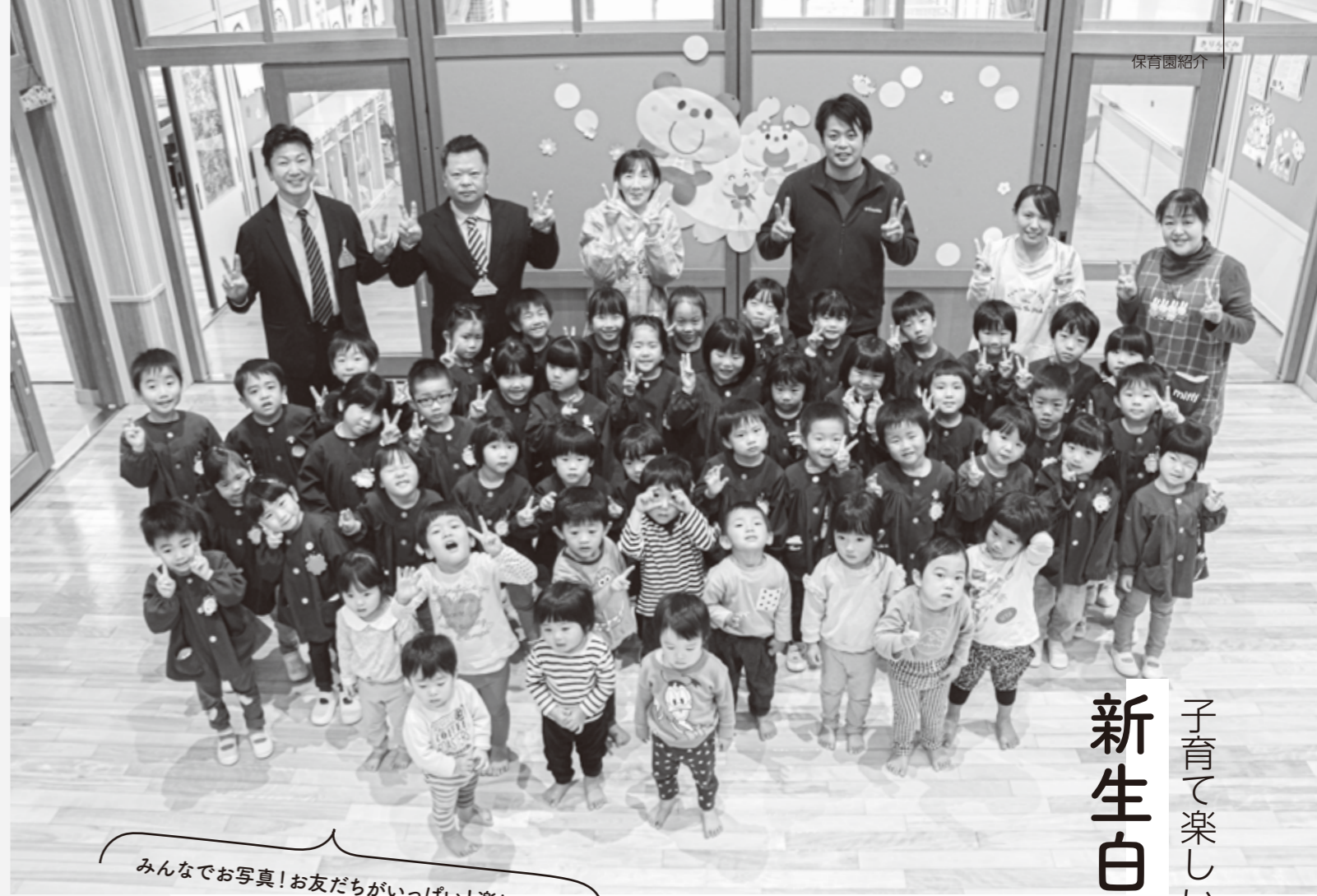
みんなで写真!お友だちがいっぱい!楽しいよ!