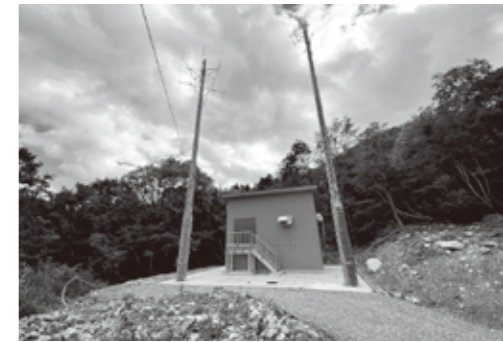
▲防災行政無線施設改修