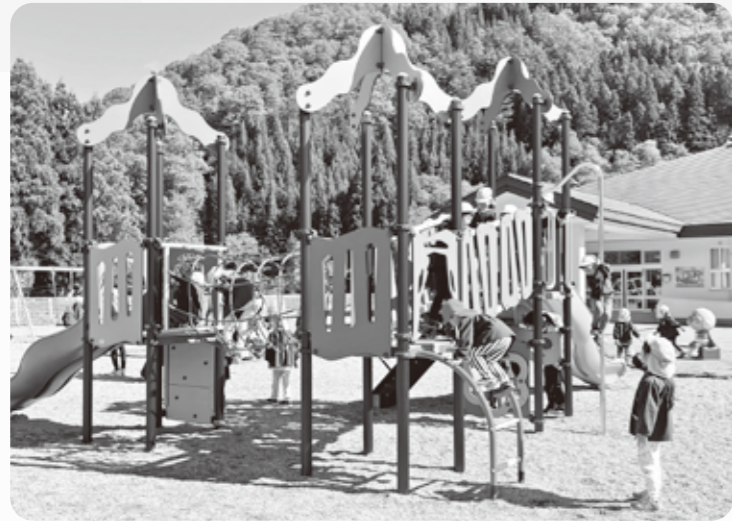
うわあ〜! あたらしいひみつ基地だ!