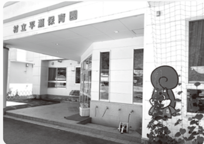
たくさんの思い出をありがとう!平瀬保育園