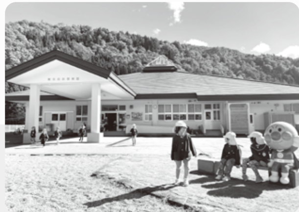
玄関もピカピカになったよ