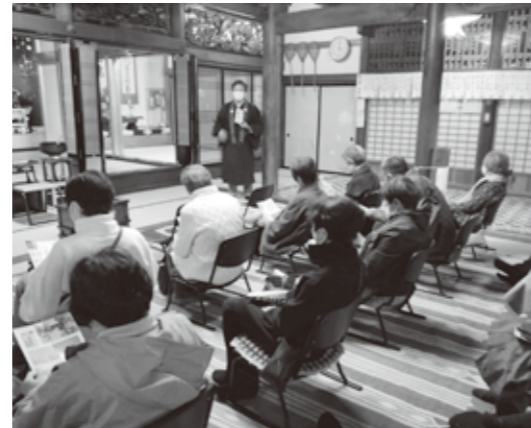
11月16日 福光美術館と光徳寺で棟方志功の作品を見学