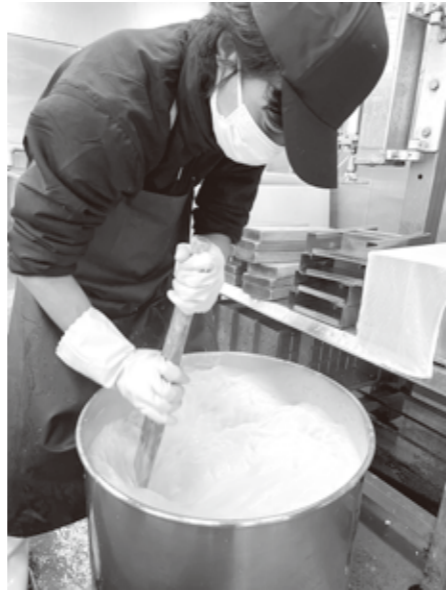
【問合せ先】観光振興課 ☎6-1311

これから厳しい冬がまたきますが、そんな冬も楽しみながら無理せず乗り越えていきましょう！また自分は主に深山豆腐店や鳩谷周辺にいますので、見かけたら気軽に声をかけてもらえると嬉しいです！