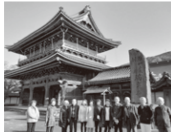
11月8日 井波別院瑞泉寺と木彫刻の町並みを散策

午前中は温水プールの中でウォーキングや運動をした後、ゆっくりと温泉に浸かり、午後は観光名所を散策しました。温泉プールは強力なジェット水流で全身を快適にマッサージができ、泳がなくても十分な運動効果がありました。