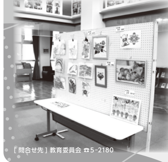
【問合せ先】教育委員会 ☎5-2180

今年度も感染症予防のため、文化展（作品展示）のみの開催となり、NBK中央ホールに展示されました。保育園、学園児童生徒、村民の方からの素敵な作品が展示され、多くの方が観覧されました。