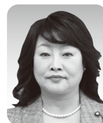
坂本 正代 議員