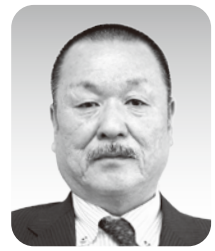
宮部 俊典 議員

Q 昨年、戸ヶ野地区において、幼児の転落事故が発生しています。私が思うに、この事故は、ガードレールが存在していたら、未然に防げたと考えます。現在、戸ヶ野地区の南側周辺は、若い世代の住宅地となっており、小さな子供が多くいます。実は、用水路もあり危険な場所も存在しています。白川村の安全・安心の確保は政策の柱でもありますので、是非、改善できる場所があれば対応をお願いしたいと考えます。