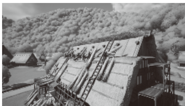
▲メタバースで結の視点体験