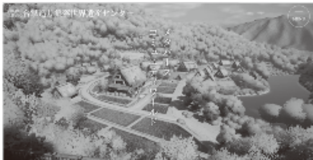
▲メタバースコンテンツ

令和5年度はウェブ及び仮想空間(メタバース)構築整備を行い、令和6年度は多言語化(英語)、ガイダンス動画の整備を行います。