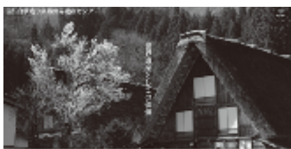
▲デジタルヘリテージセンター