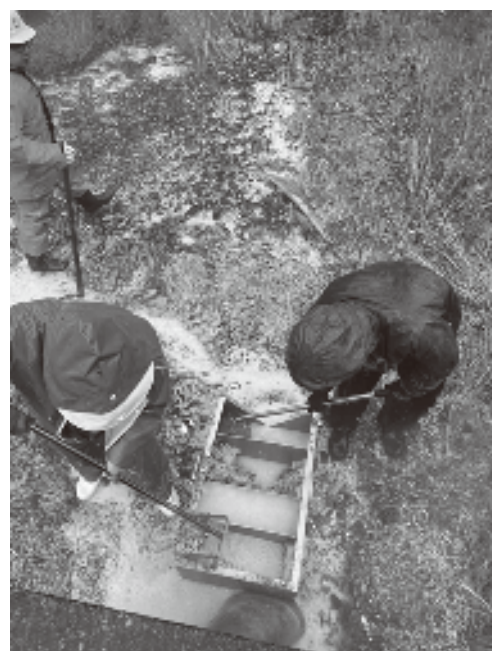
▲温泉管スケール除去作業状況