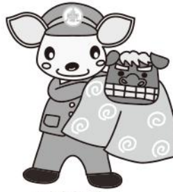
こあんちゃん 高山地区交通安全協会 白川支部