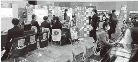
▲昨年度「オール岐阜・企業フェス」の様子

県内企業約200社が集う県下最大級の合同企業展「オール岐阜・企業フェス」を開催します。ぜひ参加ください！